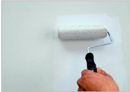
Schritt 1 - Zuerst Primus Sabbia auftragen.

La Casa dei Sogni wird mit einer weitläufigen, ungleichmäßigen Bewegung der Handfläche aufgetragen, die mit unserem mit reichlich Produkt getränktem Handschuh bedeckt ist. Trasparenze wird mit einer weitläufigen, ungleichmäßigen Bewegung der Handfläche aufgetragen, die mit unserem mit wenig Produkt getränktem Handschuh bedeckt ist. Nach etwa 30 Tagen ist die Oberfläche vorsichtig abwaschbar und dennoch leicht atmungsaktiv. Trocknungszeit ca. 4-6 Stunden. Kühl und trocken, vor Feuchtigkeit und Frost geschützt lagern.