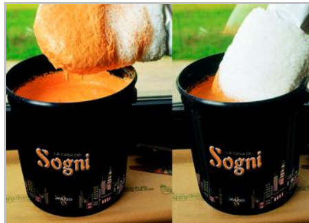
Schritt 4 - La Casa dei Sogni: Die Wand stark befeuchten. Trasparenze: Die Wand leicht befeuchten.