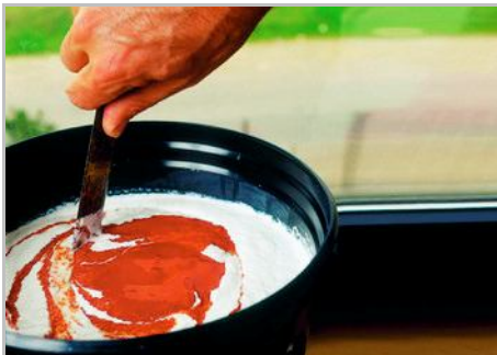
Schritt 3 - Das Produkt gut mischen.