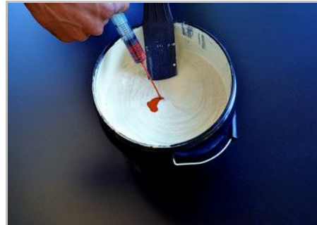
Schritt 2 - Den Farbton Casa dei Sogni herstellen.